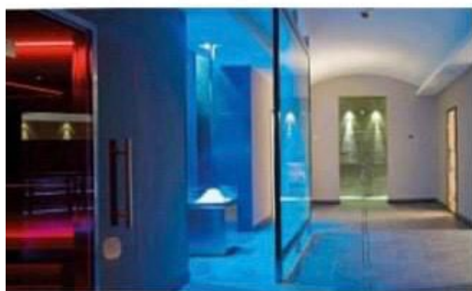
La Wellness-Private Spa di Garcia Therae . In alto, la piscina delle Terme Dolomia , in Val di Fassa; nei pacchetti ai trattamenti riabilitativi si affiancano i trekking nella natura.

I wellness center fondono atmosfera d'epoca, prodotti locali e terapie moderne